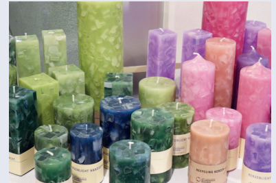
Unser farbiges Kerzensortiment.

Für unsere Produkte halten wir ständig Ausschau nach neuen Vertriebskanälen. Wir freuen uns sehr, mit Faircustomer.ch eine nationale Plattform gefunden zu haben, die neu unsere Kerzen und Notizbücher anbieten wird.