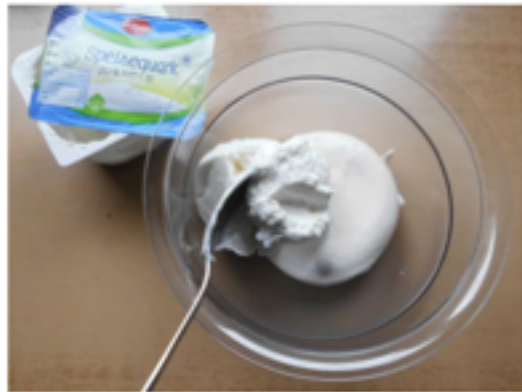
Quark in Schüssel geben