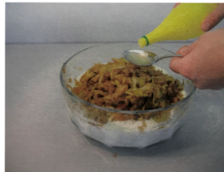
2 Esslöffel Zitronensaft begeben