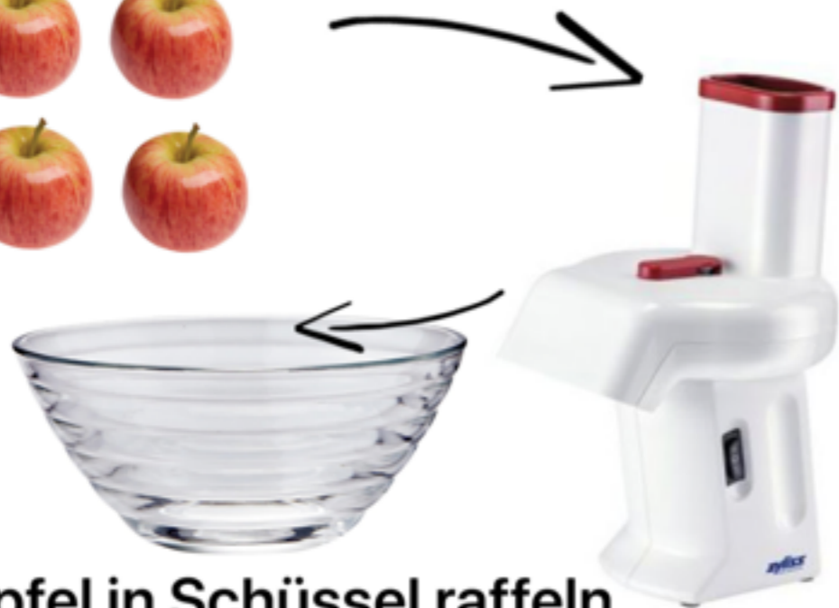
Äpfel in Schüssel raffeln