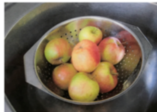
Sieb mit Äpfel ins Spülbecken stellen