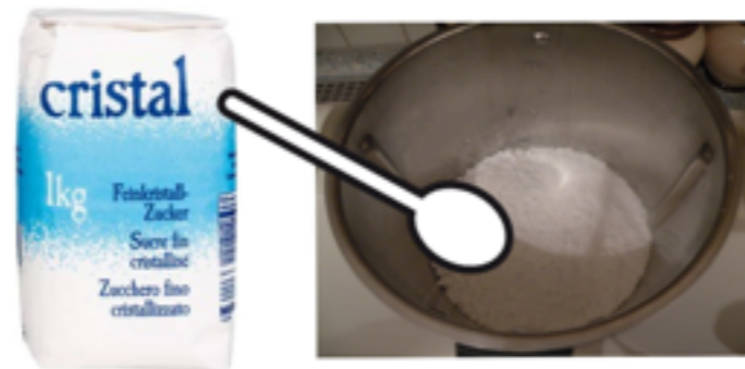
4 Esslöffel Zucker begeben